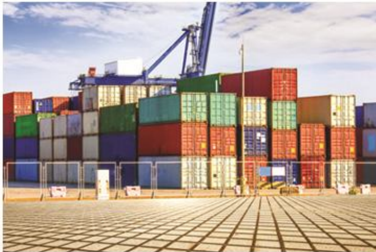
ASURANSI MARINE CARGO