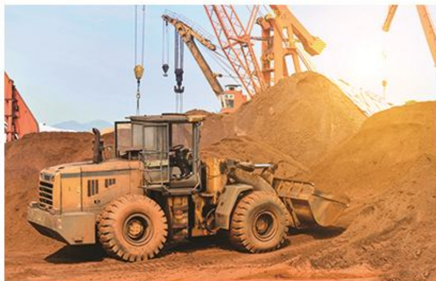
ASURANSI ALAT BERAT