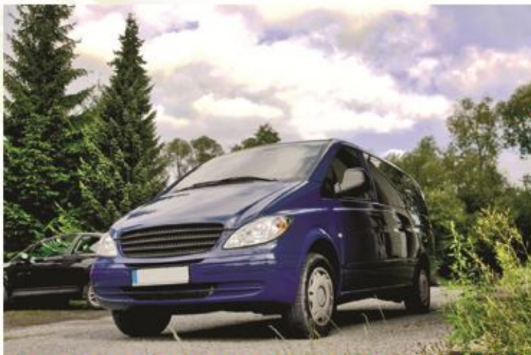
ASURANSI KENDARAAN BERMOTOR